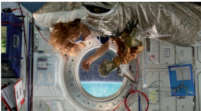
Cochemare, Chris Lavis/Maciek Szczerbowski

1.5., 23.25h: ARTE KurzSchluss Come Coco